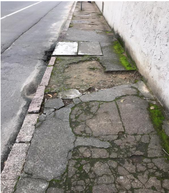
Figura 2 - Centro do Município de Urussanga - SC