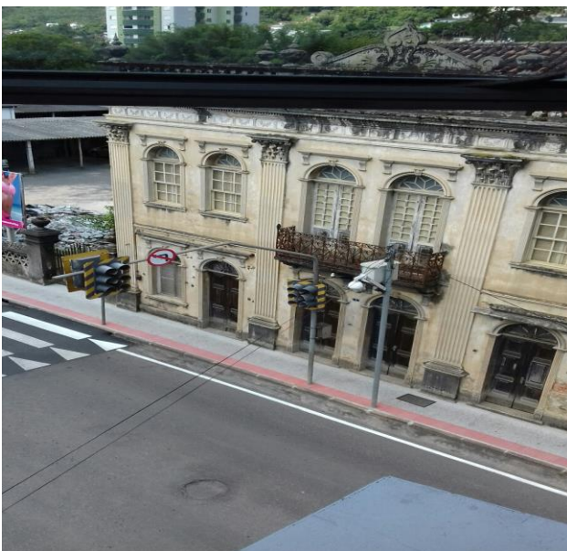
Figura 3 - Centro do Município de Urussanga - SC

Outro aspecto observado nas figuras 3 e 4 é que o sistema de sinalização para pedestres e veículos cria uma barreira para passagem de pessoas nas calçadas.