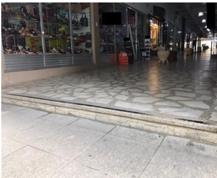
Figura 9 - Centro do Município de Urussanga - SC