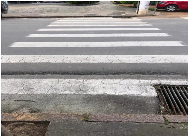
Figura 4 - Centro do Município de Urussanga - SC