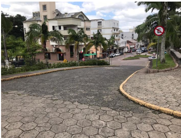
Figura 11 - Paróquia Nossa Senhora da Conceição - Centro do Município de Urussanga - SC