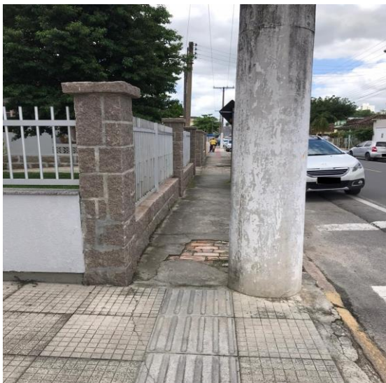
Figura 7 - Centro do Município de Urussanga - SC

Na sequência, mais imagens de obstáculos arquitetônicos, mesmo em ambientes recém remodelados. Calçada estreita, com poste largo e vários buracos (Figura 7).