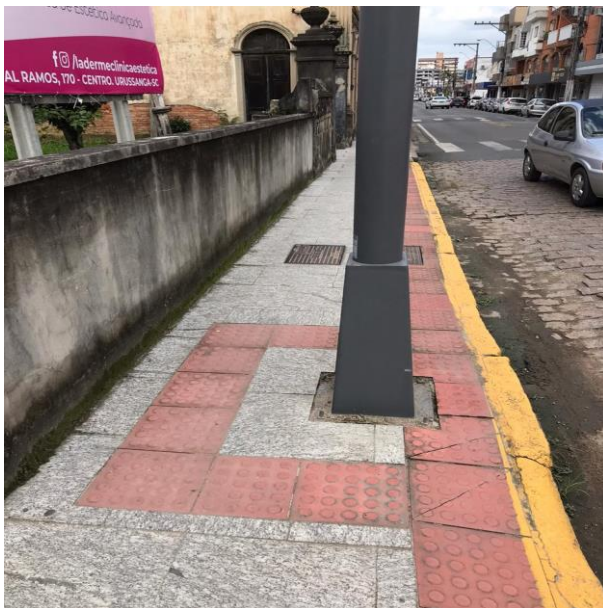
Figura 6 - Centro do Município de Urussanga - SC