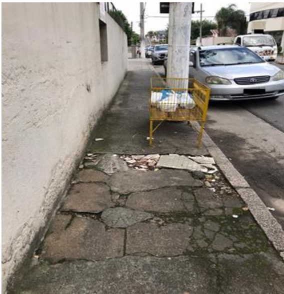
Figura 1 - Centro do Município de Urussanga - SC

Ao realizarmos a pesquisa, captamos essas imagens do centro da cidade.