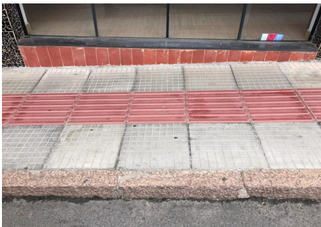
Figura 5 - Centro o Município de Urussanga - SC

Além da faixa de pedestre com elevação (Figuras 3 e 4), na Figura 5 verifica-se uma calçada, que embora com piso tátil, contém um degrau, dificultando a passagem, outro exemplo de barreira de acessibilidade (Figura 5).