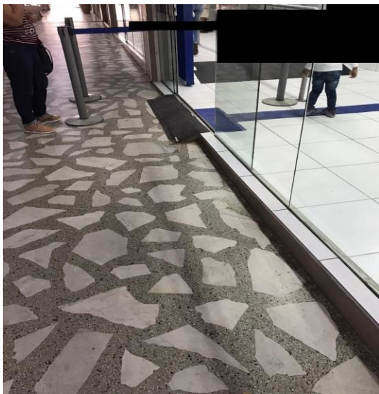
Figura 8 - Centro do Município de Urussanga – SC

Nas figuras 8 e 9 observa-se que a Casa Lotérica foi reformada para atender os requisitos da acessibilidade, porém o acesso externo ao estabelecimento não possui rampa. Nota-se na Figura 9 que a entrada da galeria que dá acesso à Casa Lotérica possui um degrau.