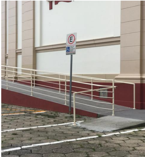
Figura 10: Paróquia Nossa Senhora da Conceição - Centro do Município de Urussanga - SC

Na parte de cima da Igreja Matriz, foi feito todo o acesso necessário, porém para subir no local, há escadas e um morro com calçadas estreitas (Figuras 10 e 11).